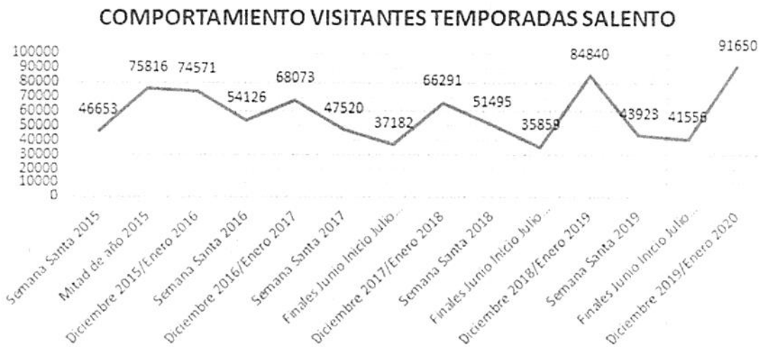
Gráfico: Secretaría de Turismo y Desarrollo Económico 2020 con datos del observatorio Turístico.